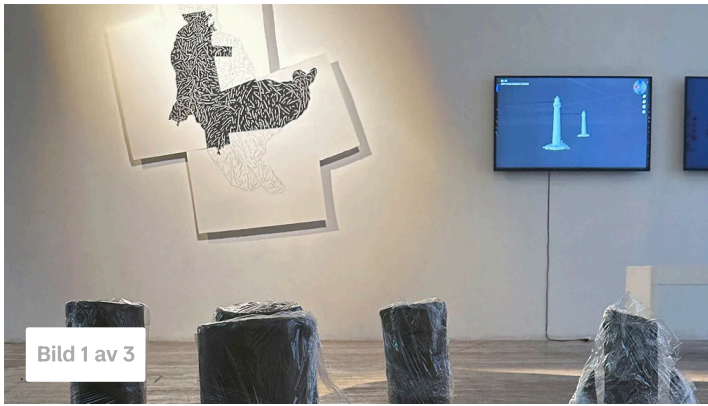
Vy från "Nutopia" på Studio 44.