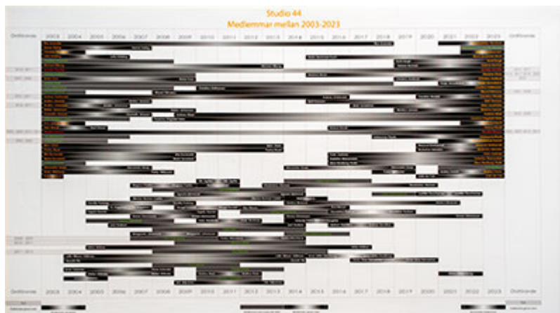
Samtliga medlemmar sedan 2003 (klicka på respektive bild för hög upplösning)

Det är en sympatisk utställningsidé att bjuda in samtliga nu aktiva, tidigare medlemmar och att man även hyllar dem som inte längre lever. Det innebär att det är många verk och en bredd av uttryck som samsas i lokalerna. Var och en ger sitt smakprov och håller sig som det verkar inom ett förbestämt format.